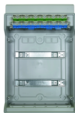
Bornier intégré pour raccordement des conducteurs PE et N.