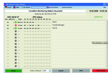
Logiciel DRC MCM XT Status Display

Les modules de surveillance disposant de la technologie LifeCheck peuvent surveiller l'état de fonctionnement de 10 parafoudres BLITZDUCTOR XT/XTU. Indication optique tricolore et contact de télésignalisation (ouverture ou fermeture).