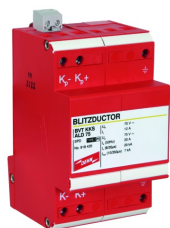
Illustrations sans engagement