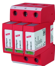
Illustrations sans engagement