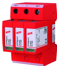
Illustrations sans engagement