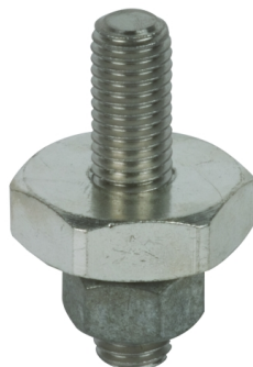
Illustrations sans engagement