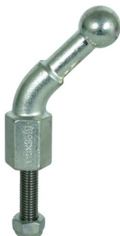
Illustrations sans engagement