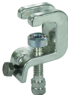
Illustrations sans engagement