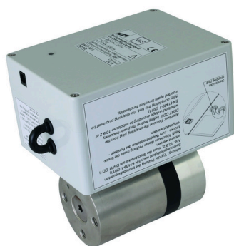
Illustrations sans engagement