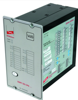
Illustrations sans engagement