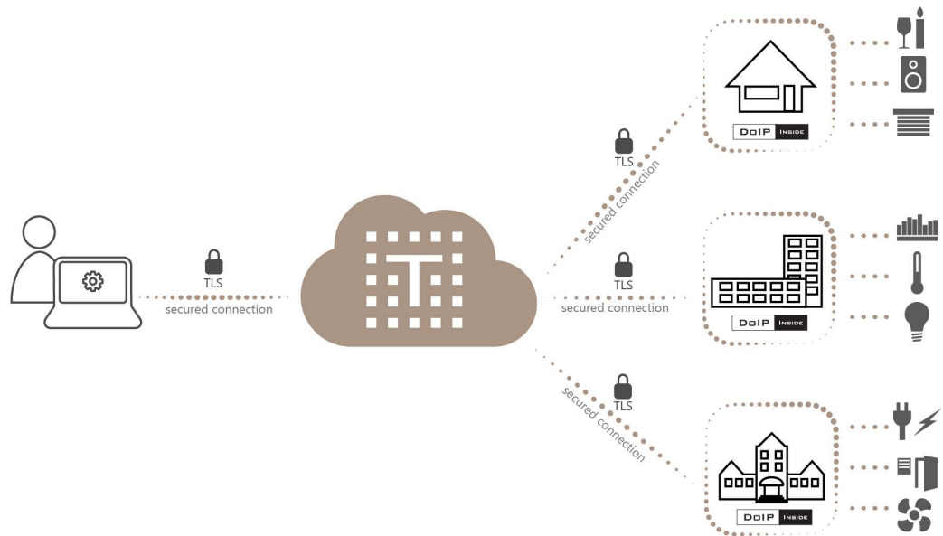
Figure: En tant qu'intégrateur système, vous pouvez effectuer des diagnostics à distance, modifier la configuration de PROSOFT et même mettre à jour les unités centrales de n'importe où, à tout moment de la journée.