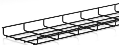
afbeelding 35x60 en 35x200 mm

De draaduiteinden van de opstaande boorden zijn afgerond om persoonlijke verwondingen of schade aan de kabels te voorkomen.