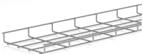
afbeelding 35x60 en 35x200 mm