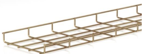
afbeelding 35x60 en 35x200 mm

De draaduiteinden van de opstaande boorden zijn afgerond om persoonlijke verwondingen of schade aan de kabels te voorkomen.