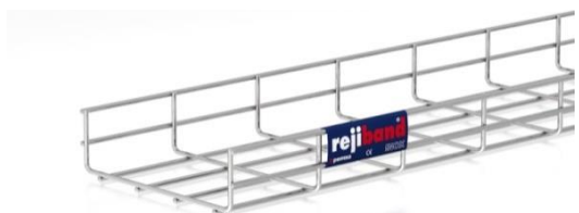
afbeelding 60x60 en 60x200 mm